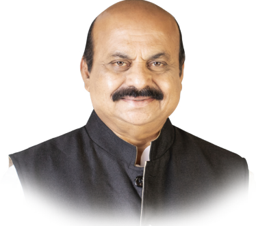
ಬಸವರಾಜ ಬೊಮ್ಮಾಯಿ ಮುಖ್ಯಮಂತ್ರಿಗಳು, ಕರ್ನಾಟಕ ಸರ್ಕಾರ