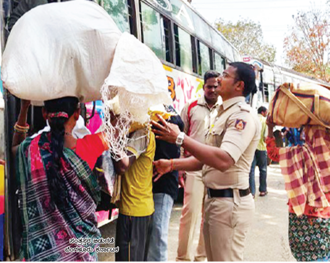
ಸಂತ್ರಸ್ತರ ಜಡುಗಡೆ ಬೆಂಗಳೂರು ಕರ್ನಾಟಕ

9. ಜೀತಕಾರ್ಮಿಕರ ರಕ್ಷಣೆ ಮತ್ತು ಪುನರ್ವಸತಿ-ಜಿಲ್ಲಾಡಳಿತ, ಜಿಲ್ಲಾ ಪಂಚಾಯತಿ ಮತ್ತು ಕಾರ್ಮಿಕ ಇಲಾಖೆಗಳ ಪಾತ್ರ.