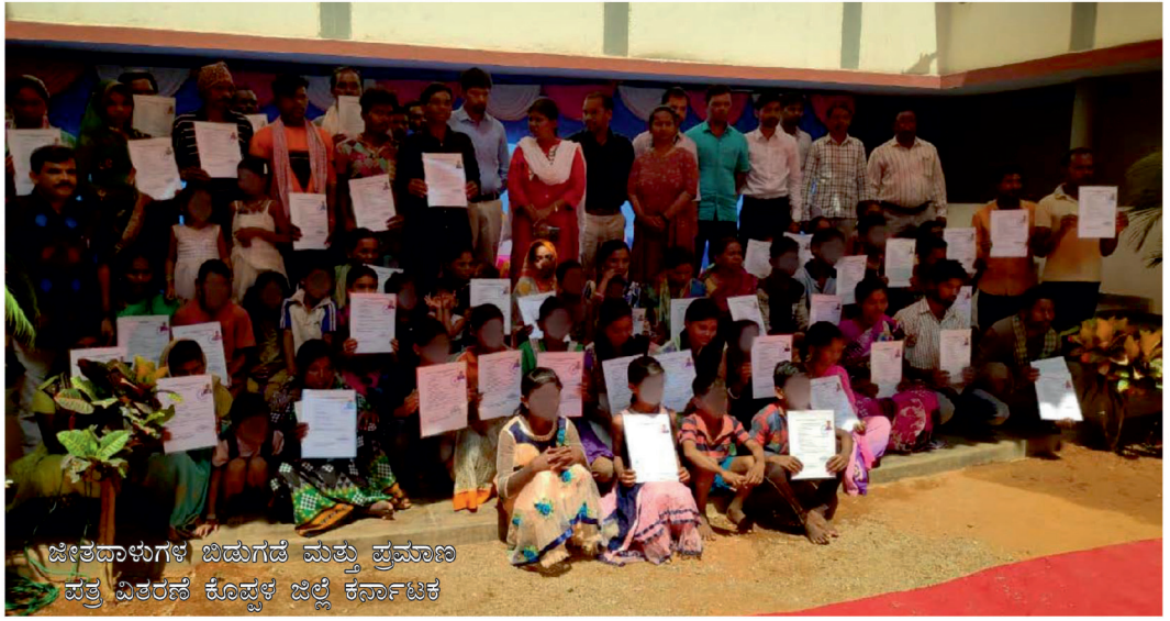
ಜೀತದಾಳುಗಳ ಬಿಡುಗಡೆ ಮತ್ತು ಪ್ರಮಾಣ ಪತ್ರ ವಿತರಣೆ ಕೊಪ್ಪಳ ಜಿಲ್ಲೆ ಕರ್ನಾಟಕ